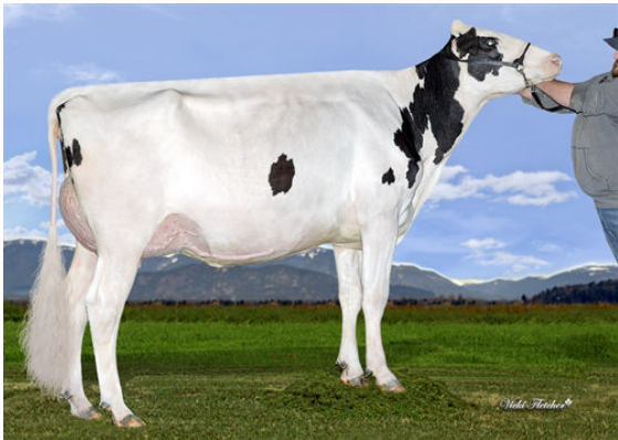
DICKLANDS KING DOC 3503 GRANDDAM