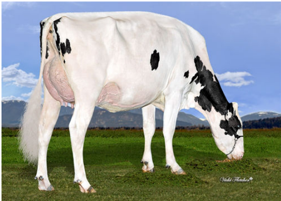
DICKLANDS KING DOC 3503 GRANDDAM